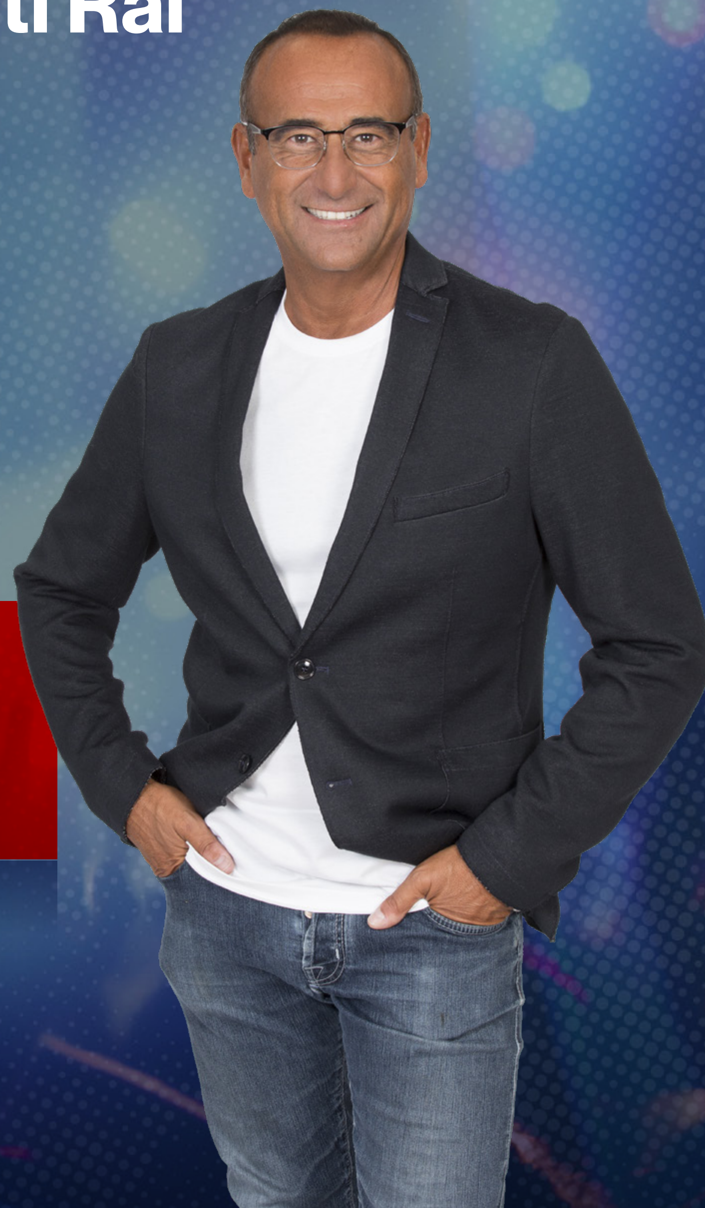
Carlo Conti Il nuovo Direttore artistico e conduttore del Festival di Sanremo