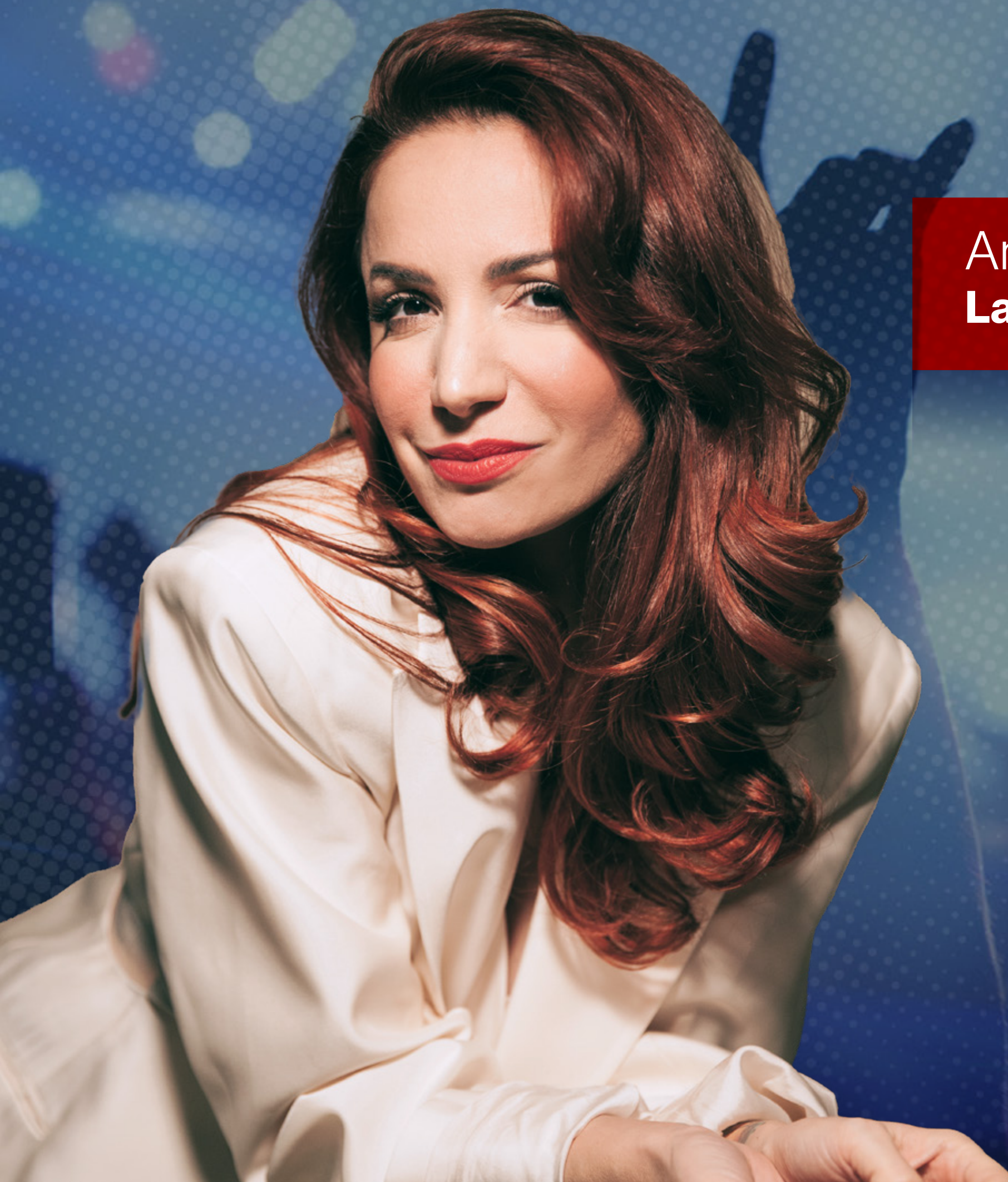
Andrea Delogu La “padrona di casa”